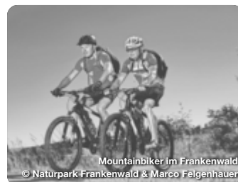
Mountainbiker im Frankenwald