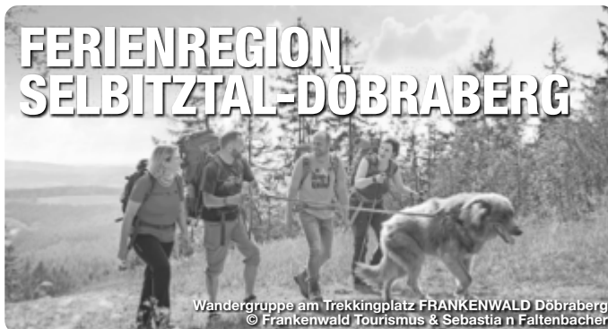
Wandergruppe am Trekkingplatz FRANKENWALD Döbraberg

Dort, wo sich Frankenweg, Rennsteig, Fränkischer Gebirgsweg und Frankenwaldsteig treffen, liegt eingebettet in den Naturpark Frankenwald, das Urlaubsgebiet der Ferienregion Selbitztal-Döbraberg. Wanderer und Radler finden hier ideale Bedingungen für einen individuellen erholsamen Aktiv-Urlaub. Alle sieben Urlaubsorte der Ferienregion sind zu jeder Jahreszeit eine Reise wert! Lernen Sie dabei die herrliche Mittelgebirgslandschaft auf abwechslungsreichen Wander- oder Radtouren kennen. Genuss-Wanderer und auch die Freunde langer Strecken finden garantiert ihren Weg in der vom Deutschen Wanderverband als Bayerns erste prämierte Qualitätsregion „Wanderbares Deutschland“. Highlight ist das wildromantische Höllental, ein wunderschönes FFH-Schutzgebiet, welches auf verschiedenen Erlebnispfaden erkundet werden kann. TreffpunktDeutschland.de/selbitztal-doebraberg