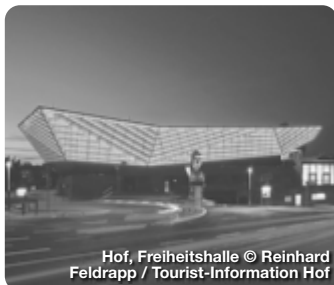
Hof, Freiheitshalle