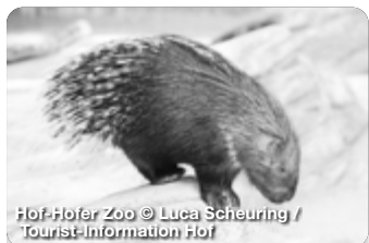
Hofer Zoo